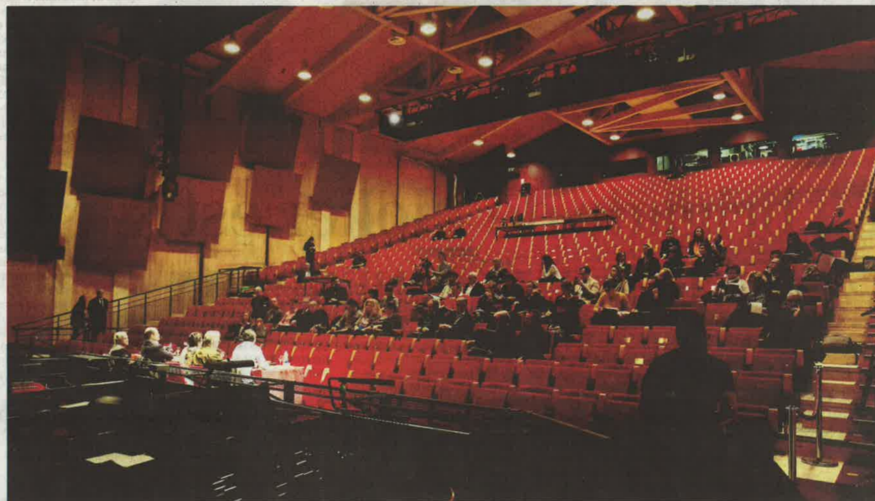
Les Genevois pourront juger par eux-mêmes la beauté de l'Opéra des Nations lors des portes ouvertes du dimanche 7 février, de 10 h 30 à 19 h. GEORGES CABRERA