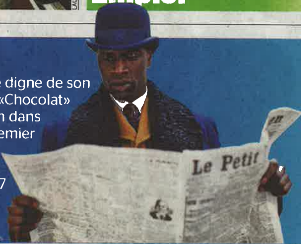
0698 A 23

Omar Sy tient un rôle digne de son immense talent dans «Chocolat» de Roschdy Zem, film dans lequel il campe le premier clown noir français à avoir connu la célébrité. Page 27